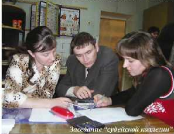
Заседание "судейской коллегии"

В ЮЭС ОАО «Хакасэнерго» прошли соревнования среди электромонтеров по оперативным переключениям в распределительных сетях и электромонтеров оперативно-выездной бригады. Впервые в соревнованиях приняла участие женщина - и среди электромонтеров оперативно-диспетчерских групп она оказалась лучшим мастером своего дела.