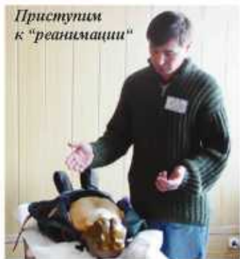
Приступим к "реанимации"

Сектор по связям с общественностью и работе со СМИ ОАО «Хакасэнерго»